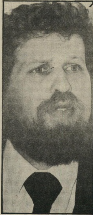
תובע לנדשטיין ישר לעיניים: כן!

ולהעיד כעדת-תביעה נגד צעיר שנאשם בסרסרות לזנות של אחת מחברותיה.