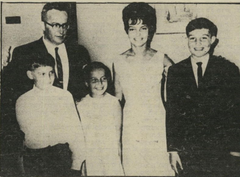
האשה והילדים כמי שצולמו בעת שלורך היה ציר בצייילון. הוא נשלח לשם שלא על דעת ממשלת צייילון, כאשר משרד-החוץ קובע עובדה בשטח. הצייילונים לא יכלו לשלוח את המישפחה הדיפלומטית בחזרה לישראל.

לורך מונה לתפקידו כאשר ברקת היה יו"ר הכנסת. לאחר מכן עבד עם ישראל ישעיהו. הוא אינו חול מלהתפעל מהעברית