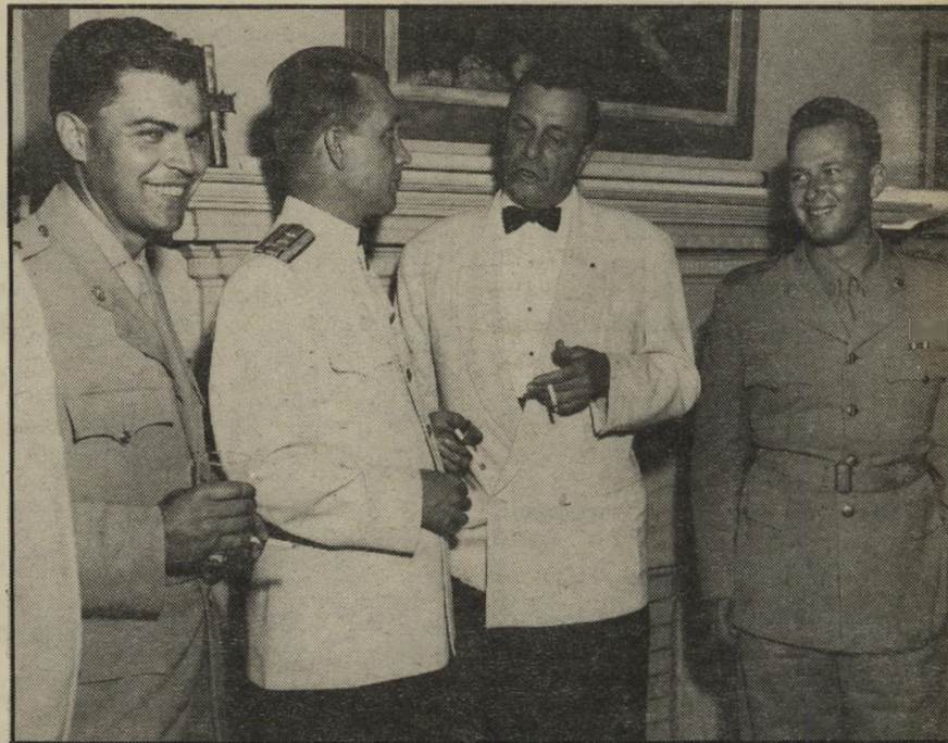
פלד (משמאל) עם רבין (מימין) בסיוור בארצות-הברית. יש לי עבר משותף עם חברי האלופים, אך אין לנו עניין משותף.

מבחינת המהות והתוכן, כבר אז האמנתי בדברים שבהם אני מאמין היום, כבר אז החזקתי באותן העמדות. כעבור שנים, כשעזר וייצמן היה שר-הביטחון, הורה לפני שחל בו שינוי גדול, ואמר לי: נו, אתה יכול לטעון כנגדי שכבר אז,