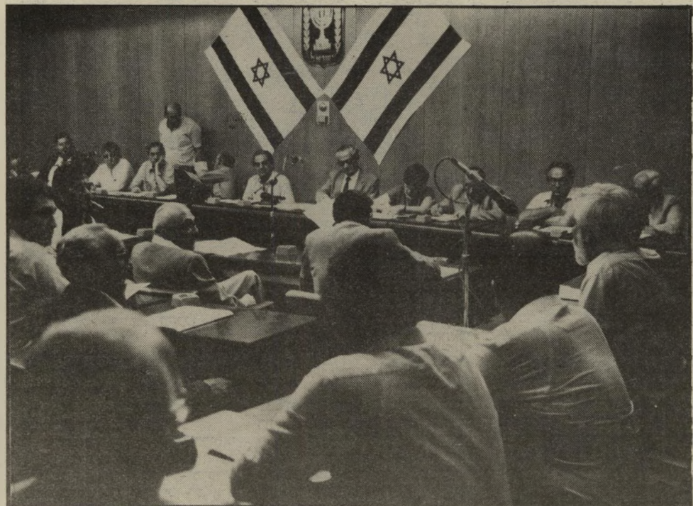
נציגי הרשימה המתקדמת בשעת הטיעון בוועדת הבחירות ציונים כשרים, עם חותמת

לשם כך העלתה את משה דיין מהקבר. לרבריה, הוא אמר פעם: "מי שעויר הוא לא מי שאינו רואה, אלא