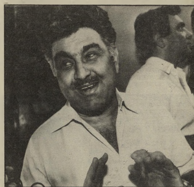
השר ניסים לא קיים

יריביו טוענים, שהוא יוצר חיץ בין ראשי-המטה ושאר העובדים בבניין. ישיבות המטה כבר זכו לאי-יחסי רבים בעיתונות. בעיקר בגלל התפרצות יותיו של לוי ומריבות קולניות בין הנוכחים. אילו יכלו, הם היו חותכים זה את זה. "אמר פעיל במעלית לפעיל אחר, שתעה בין 13 קומות הבניין. לוי שונא כשהולקים על דעתו, מעירים לו או מנסים לעוץ לו עצה. בגלל תכונותיו אלה הוא הספיק כבר להסתכסך עם רוב חברי מטה-הבחירות. כשהוצע שמאיר שיטרית יגיש את התשדירים, כי הוא "עובר טוב במסך", התנגד לוי בטענה שהוא "צעיר מדי". האיש המבוקש ביותר בבניין בעונת הבחירות הוא הרוב. זה האיש שבא בקשר עם העיתונאים בארץ ועם הכתבים מחו"ל, מטפל ביחסי-ציבור יזומים של המפלגה ובונה את תרמיתה, שהיא כה חיונית ערב ההצבעה.