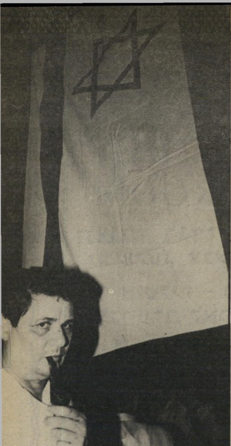
שר-לשעבר ארידור המערך יישאר עם השקלים

המחיר בפיקוח, תתפלאו, אמרתי לעצמי, שכרי לעשות עבודה טובה, אין טוב מאשר ללכת למקורות. כך עשיתי. אולי, אולי בכל זאת העלו מגדלי הקפה רחבי העולם את מחירו, ואנחנו, שאיננו מגדלים קפה, חייבים לשלם את מחירו העולה. אולי. חיפשתי ומייד נזכרתי בפיננשל טיימס. המפרסם מדי שבוע מה קורה בשוקי-הגלם והמוזנות, ובכללם הסחר העולמי בקפה. מצאתי כיום השישי האחרון היה מחיר טונה של קפה. המורכבת מ-1000 קילוגרם, בדיוק 2224 לירות סטרלינג, כשמועד ההספקה הוא ספטמבר. המחיר הכי גבוה שאליו הצליח להעפיל הקפה