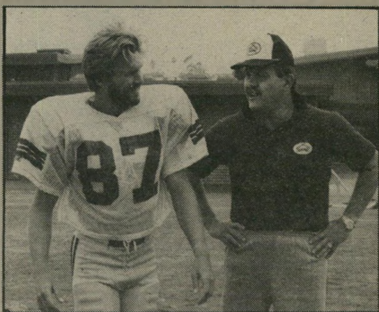
ג'ף ברידג'ס ואלכסיס קאראס: חבל עליהם

האקפורד נלכד כנראה במלכודת של עצמו. מאיט את הקצב כדי להגביר תחושת החשיבות של כל העניין. נאחו בנופים ובתנאודות כדי למלא חללים. ובסופו של דבר, כורע הסרט