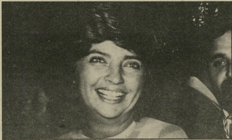
סגנית סאר שמועה אחרונה