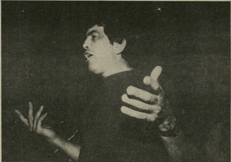
מנחה שגריר ארץ ישראל אחרת