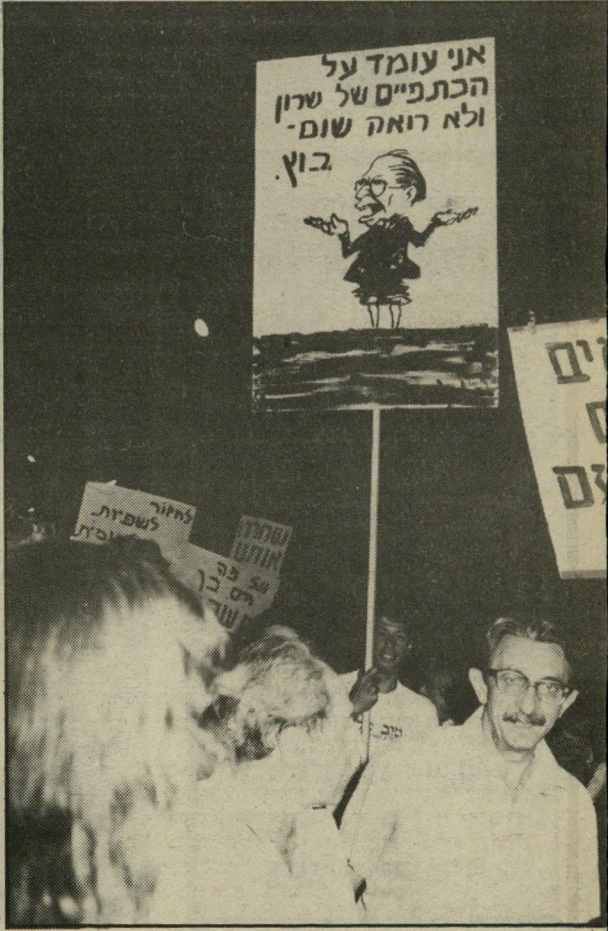
הפגנה נגד מילחמת-הלבנון

שימוש בגזים. שלוש פעמים פנינו מאז, ועדיין לא קיבלנו את הנוהלים. אם לא נקבל את הנוהלים נפתח בתביעה ציבורית להקמת ועדת-חקירה ציבורית.