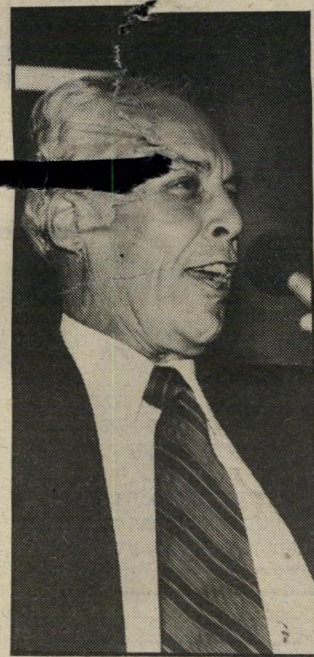
איש יחסי-ציבור רפפורט המיקצוע נשאר במישפחה

ריצ" את 12 מיליון הדולר שלה, בצוואה שבה נקבע כי כספו של רבר יגיע כל הכסף לידי בית-הספר לרמאה וטרינארית של אלכמה, אבל אך ורק בתנאי שלא ימשוך סנט אחד מן הירושה, כל עוד אחרון הכלבים חיים ולרוחח, סיעודם והחוקתם.