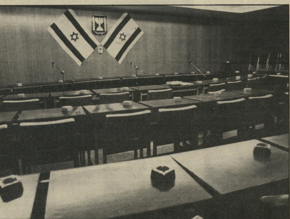
הישראלית, אחרי שחברי-הוועדה רוקנו אותה מתוכנה. בחודעת הרשימה, אחרי ההצבעה, נאמר: "הונחתה מכת-מוות על הדמוקרטיה הישראלית..."

לפי החוק, מהווה בית-המישפט העליון מוסד של עירעור על החלטה כזאת של ועדת-הבחירות. לפניו יובא העניין בעוד כמה ימים. בבית-המישפט יהיה תלוי אם ניתן להציל שארית כלשהי של הדמוקרטיה הישראלית מידי מהרסה, מחוללי ההפיכה ה"ביטחוניות", או שנהרץ דינה