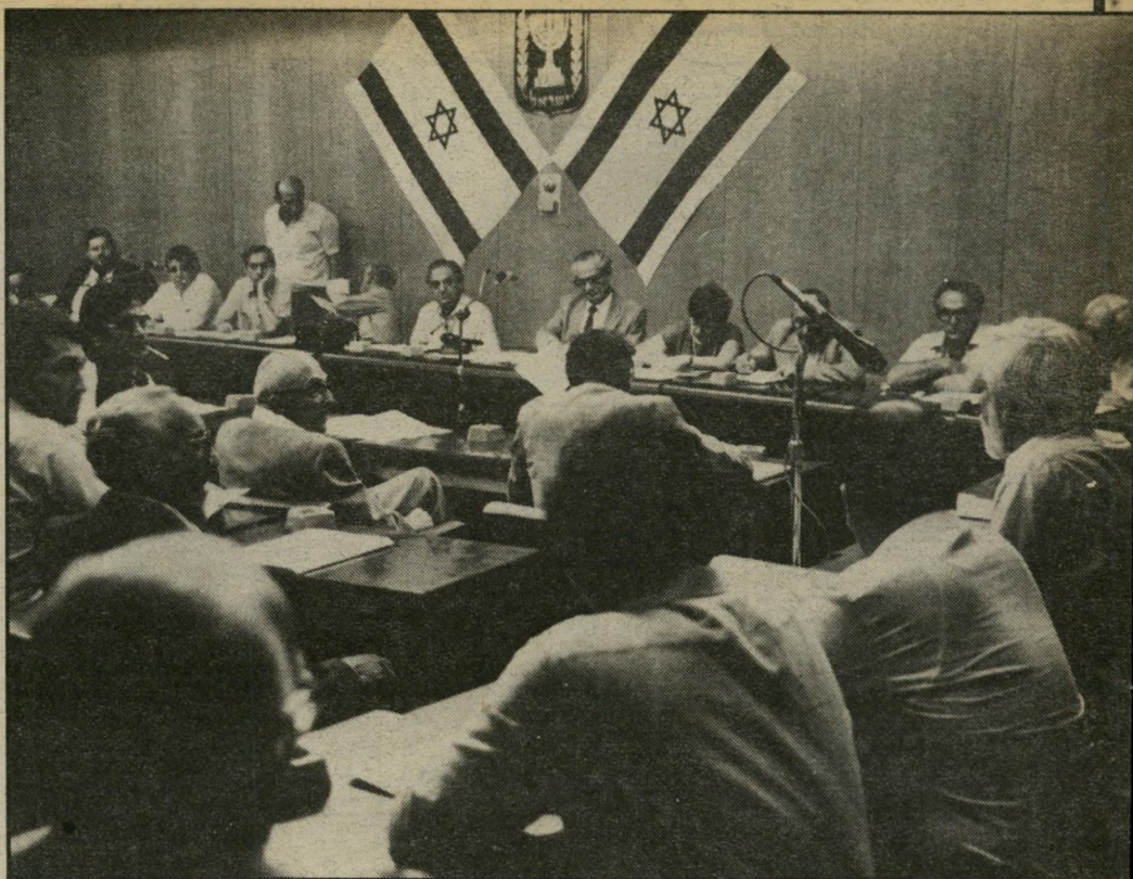
שנים, ושהובא כטענה נגד המועמד הראשון. משמאל נציגי הרשימה. בישיבה דובר הרבה על חומר "חסוי" של השב"כ, שאיש מחברי הוועדה לא ראה אותו.