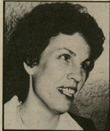
המפקחת על הבנקים מאור עם תנאים לסיוע

אבל זה לא יקרה. כי במערכת הבנקאית צריך תמיד להגיע להסכמה, ותמיד על חשבון הקוחות. וגם בנק ישראל אומר — ליתר דיוק, ראשית — כי הבנקים צריכים לשקם עצמם. ותמיד בסיוע הנדיב של עמלות שאנחנו נאלצים לשלם. ולא רק עמלות.