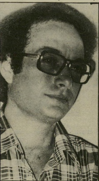
מחבר כהן-שגיא המתנה בדריכות

מאז שהוא עזב את תל-אביב ומתגורר ברעננה, הוא ממעט להתחכך בחוגים הסיפורתיים המתרכזים בבתי-קפה שונים בעיר. וזה רי חסר לו