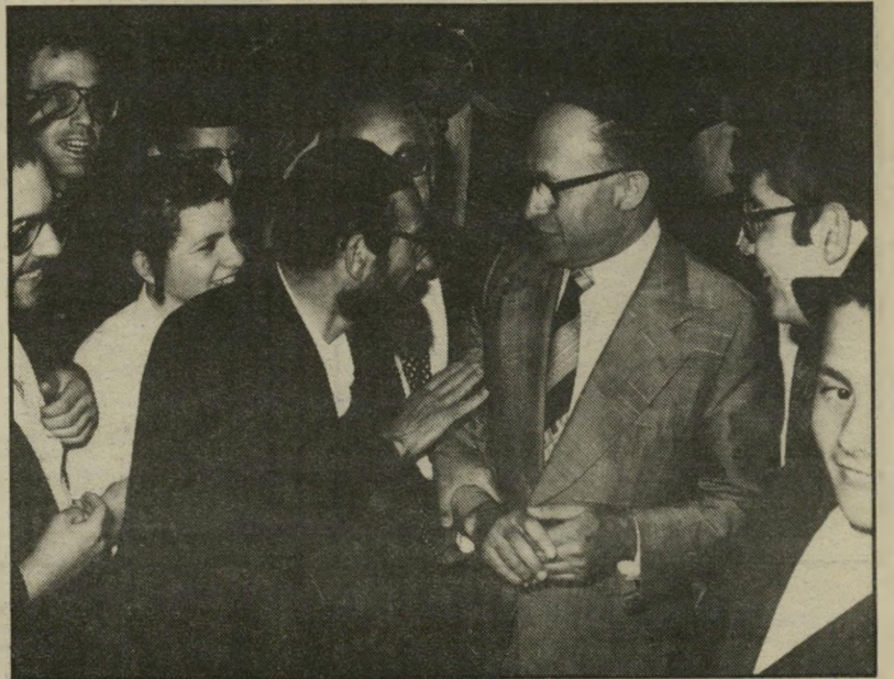
לייבלה וייספיש עם מנחם בגין, לא פוחד ממצלמה

עדות למעמרו הנחות של טוביה סער כמנהל-הטלוויזיה בימים אלה התגלתה ערב חגי-השבועות, כאשר העלימו העובדים את