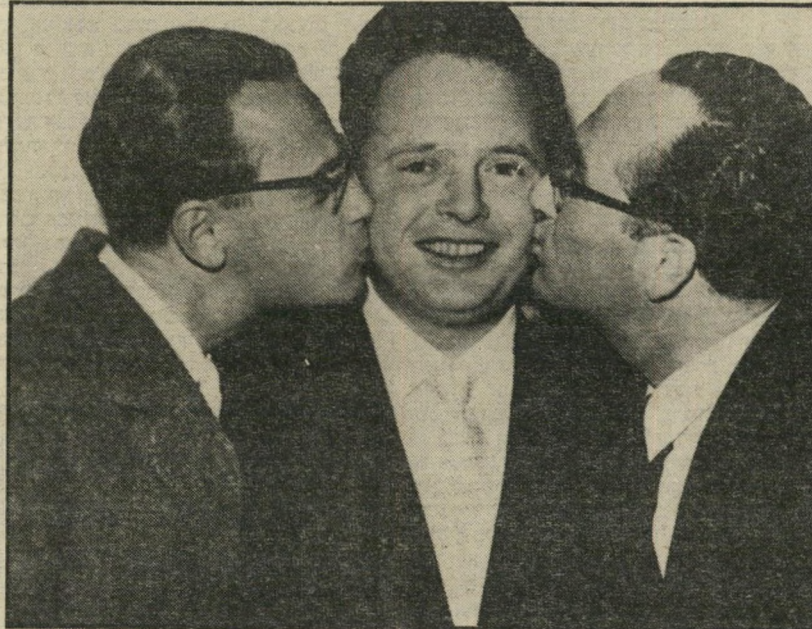
לפיד בין דוש וקישון המאפיה ההונגרית

יש בו בטומי לפיד גם מזה וגם מזה: מצד אחד ליברל שלחם כשהיה עורך ירחון הנשים "את" לשוויון-זכויות מלא לנשים, כשהוא מאמין בלב ונפש כי הן זכאיות לשוויון. מצד שני, שמרן מאין כמוהו בכל הנוגע לארץ-ישראל. בכל הנוגע לדעותיו הפוליטיות. מצד אחד הומני בצורה בלתי רגילה, כשהוא מדבר על רצח הילדה משכם, ומצד שני קיצוני בצורה בלתי רגילה כשמדובר בראיון ראשי-הערים ומעצבי דעת-הקהל בגדה.