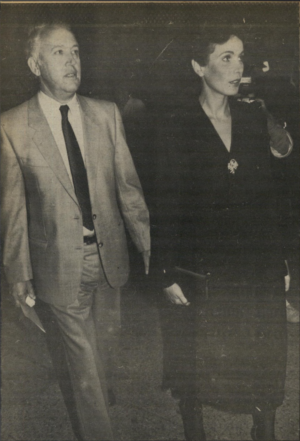
נלה וגר יעקובי יותר מאושר, יותר נוח לבריות

הנערץ עליו, אומרת בסירוש: מרחב ירושלים, ביקעת הירדן, גרש-עציון, השטח שלאורך כביש לטרון, דרום רצועת-עזה וכל הישובים הקיימים בשטח הים לא יכללו באוטונומיה.