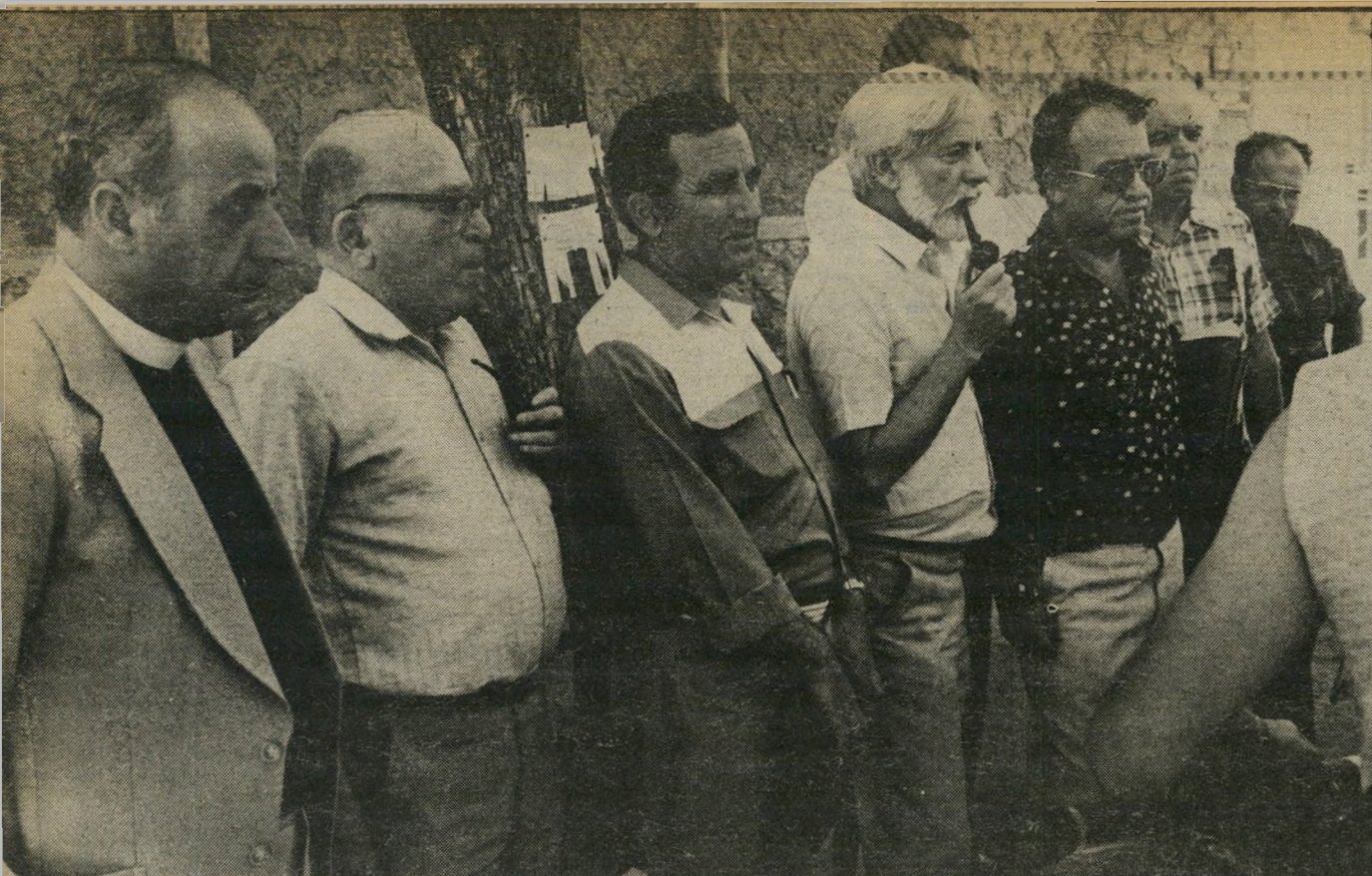
מעל הרכוז, לעיני מנחם בגין, את הרג' לים השלובים של ישראל ופלסטין.