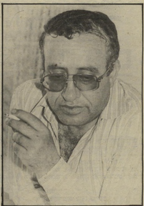
מועמד מייעארי כל היהודים הם תמימים, כל הערבים חורשים מזימות

ביותר. האמת היא שלא רק הערבים, אלא גם המועמדים היהודים, האו"ם וכמעט כל העולם התרבותי רואה כיום באש"ף את הנציג הבלעדי של העם הפלסטיני שמחוז לגבולות ישראל.