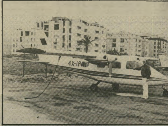
הבר מצביע על מטוסי-הברחה להפסיק לטוס

העיד כי הרגיש את עצמו בסך הכל כמו נהג מוגינת.