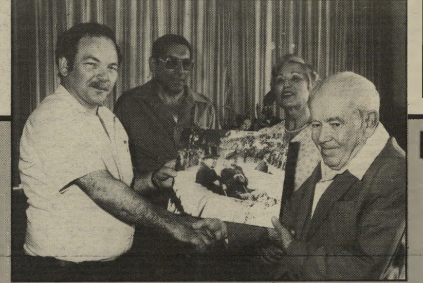
צלם ארדה (מימין) במוסיאון. אם תפנו לציף — תקבלו בחינם!

לפני כמה שבועות פנה ידחן אגודת הסופרים, מאזניים — מוסר ציבורי מכבד לא