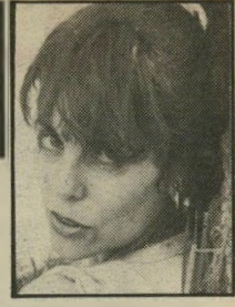
רק לא אגואיסט

עליה. ועוד מפי: סכס זה דבר יפה בין שניים. בין חמישה זה דבר נהדר.