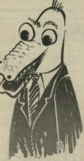
ומסודרת, כי אני לא מסודר, אבל אוהב סדר.

ולאספות-הורים. רוצה מישהי שאוהב בת בית חם, לא כסיגנון של כל יום בוא נאכל במיסעדה. רוצה אשה נקיה