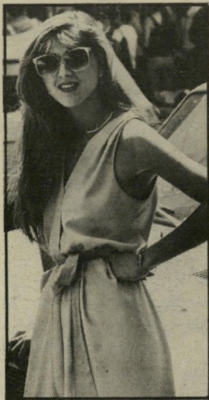
שימלה משוק בצרלאל שחקניות, עורכות־דין ודוגמניות

אני קוסטימאית במיקצועי, וכי נוסף לכך אני גם מנהלת כאז את