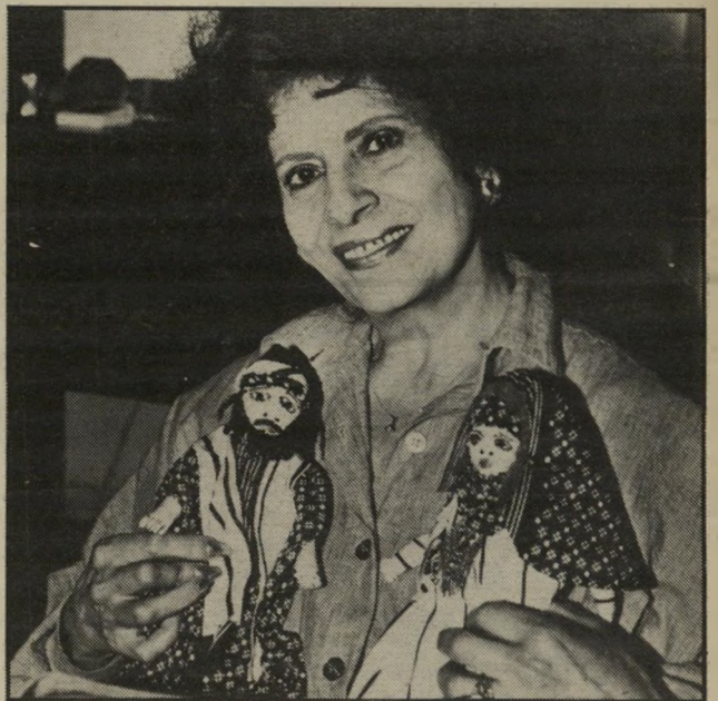
דמארי ובובות מעשהידידה אשת-איש, אמא. אשת-בית

אני גורעת מעצמי מתחים בעזרת חוכמת-החיים שלי. אני לימד אותי איך להבליג, להתגבר על דברים ששליים, לא לקחת יותר מדי ללב. הוא היה אומר: אלוהים ברא שתי אוזניים — אחת לשמוע, אחת לדורוק, היו לה תקופות, שבהן היתה צלגלה יותר. באחרונה רתה. אבל להתאמץ כיוון מיוחד, היא אומרת. אילו הייתי מתאמצת, הייתי משיימה.