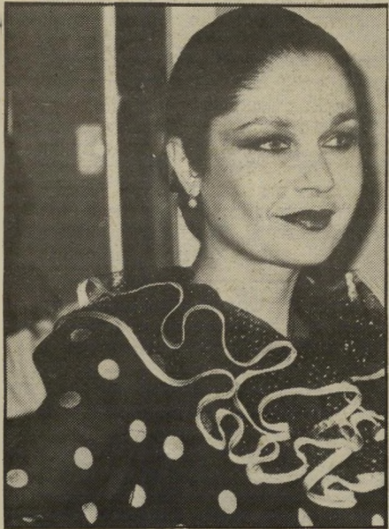
חניטה צינצ'נר להיזהר מטעויות

כשלמדת בסמינר לוינסקי התלוננו המורים שיש לי ראש מצויין לשטויות, וראש כרום למרעים מדויקים, כמו מתמטיקה, למשל. כמשך השנים הלכו הדברים והתחדדו, ואם יכולתי פעם לצרף צירופים, היום — השם יעזור.