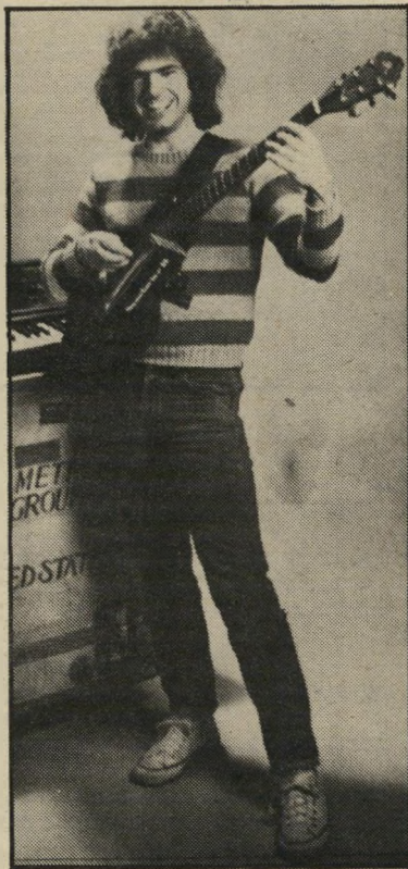
גיטאריסט מתיני יחיד גם בארץ

רוצה לראות את האורות הבהירים הלילה. זהו אלבום הראשון, משנת 1968, והוא מצויין. עד 1982, שנה בה נפרדו בני הווג והוציאו לאור את תקליטם תירו באורות, הקליטו שישה אלבומים. רובם אזלו מהשוק לפני שנים ורק כשבועות אלה הטיבה אותם חברת תקליטי קרטיינג האמריקנית מחדש. זו חברת תקליטים