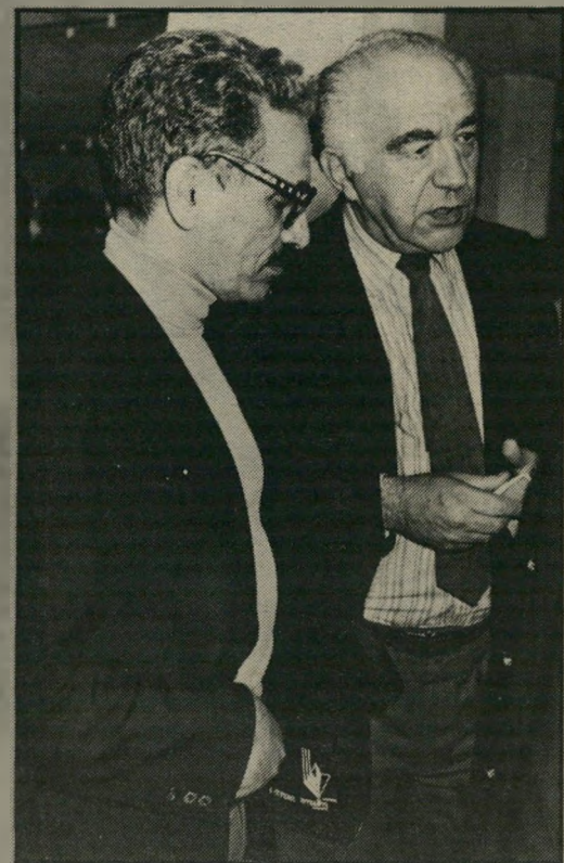
יורי, בור, בלומנטל ומזכ"ל קיסר לחסל את החרפה

חברת איסקור הממשלת לעובדיה השחורים פחות מחייבת השכר המשתלם ללבנים, ניצלה בזכות