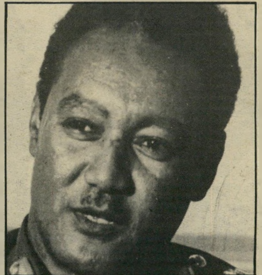
שליט נומיירי רופאים, לא תליינים

בהררמה מלאה או חלקית. בשבוע שעבר בוצע פסקי-הדין הראשון שהוטל עליידי בית-הדין האיסלאמי. שני אזרחים סודאניים, שגנבו חוטי-חשמל, נשלחו על-ידי השופטים הנכבדים לביצוע קליני של קטיעות. סוכנות-הידרועות של סודאן — לברבארים של 1984 יש סוכנויות-ידיעות, והם רואים לפרסם