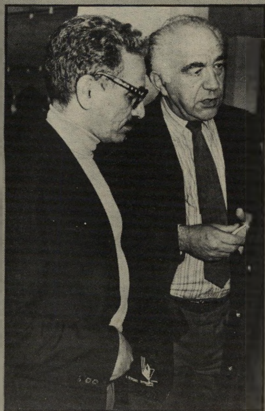
ידיד "בור" בלומנבל ומזכ"ל קיסר לחסל את החרפה

עיתונאי אוסטרלי אמר השבוע להעולם הזה, שרוב האוסטרלים הם גזענים, המתכחשים ככל כוחם למציאות הגיאופוליטית שלהם. כמונחים ישראליים הם אינם רוצים "להשתלב במרחב". סקר עיתקהל, שנערך בשבוע שעבר באוסטרליה, מאשר את הגרסה הזאת, ואף מרחיב אותה. נראה שלא רק בוחריו המיפלגות הרכושניות מגלים נטיות גזעניות, אלא רוב תושבי המדינה, גם כאלה שהצביעו לא מכר עבוד הלייבור. פרופסור מכובר וגזעני. תוצאות המישאל הן חרי משמעות. 62 אחוז מכלל הנשאלים מתנגדים לכניסת אסיאתים לתחומי אוסטרליה כמהגרים. הם מעדיפים במפורש מהגרים ממוצא אירופי, וכראש ובראשונה אנגלים. המישאל בא בעיקבות חסיסה קשה ברעת-הקהל, אחרי שפרופסור מכובר מאוניברסיטת מלבורן, ג'פרי בלאיני, האשים את ממשלת הלייבור ברדיעה קדומה אנטי-בריטית. בלאיני, הירוע ברדיעותיו הגזעניות, טען