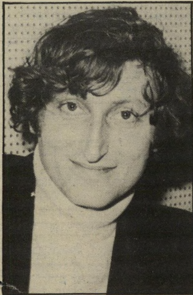
עורך הלפרין הכל משודר בירדן

אם לא יושם סכר לסיגנון של פירסומת סמויה של מוצרים שונים בתשדירים אלה הם עשויים עד מהרה ליהפך למערכת פירסומית,