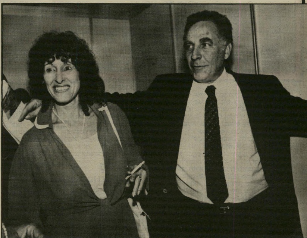
לא נכח ראש עיריית ירושלים, טדי קולק, אבל ראש-הממשלה ורעייתו כן כיבדו את האירוע בנוכחותם. ובחוץ המשיכו האמנים להפגין, למרות שבאולם הופיעו אמנים ישראלים ביצירה ישראלית.