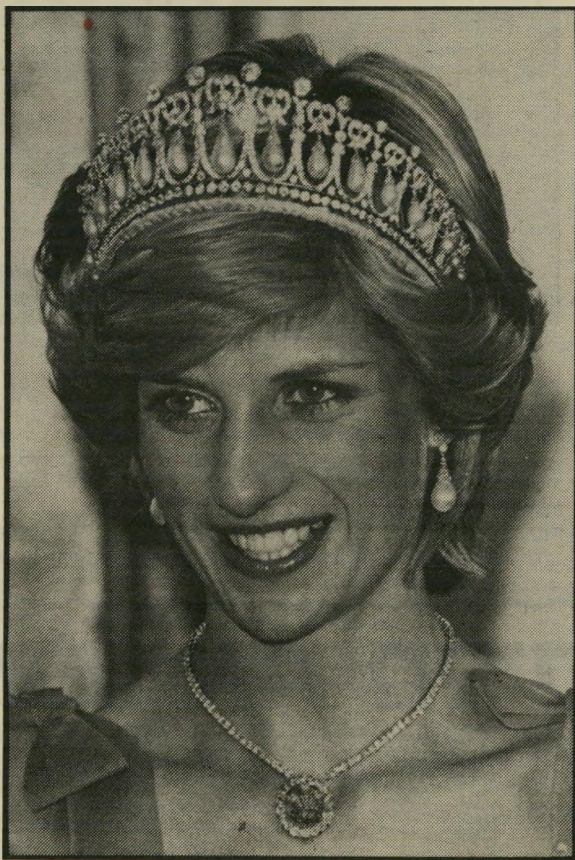
הנסיכה דיאנה בתא אחד

"סורי. אינני מסגיר מקורות-אינפורמציה." "בחיאת דינאק, אף אחד לא יודע שהגעתי!" "אז אף אחד לא סיפר. מה את עושה הערב?" "אוכלת איתך ארוחת-ערב, מותק." "איך ידעת?" "אינני מסגירה את מקורות-האינפורמציה שלי." "אחרי שעתיים אני עולה לדירתו של סגן הנשיא. את הדלת פותחת יפהפיה, כוסית בידה, ומציעה משקה. סגן-הנשיא משוחח עם ניו-יורק מהחרר השני. קוראים לה צ'ארל, והיא עוסקת, בין השאר, בהדרכת תיירים ברחבי אירופה. ממאמות היא מבינה גם בעברית. תהרגו אותי אם אין לה דם יהודי ארום כימעט בכל עורקיה, ואיזה עורקים! השיחה לניו-יורק מסתיימת, סגן-הנשיא נכנס, מבסוט עד הגג. מה