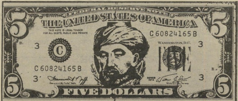
הפיתרון של רבנו בנימימון השבוע

מי שהוא אמר שישאל, בניגוד לאמריקה, היא ארץ האפשרויות הבלתי-מוגבלות. בעיקר, ככל מה שנוגע לענייני המשק, או, אם תרצה, הכלכלה. הנה, יש לי כמה שאלות, שאותן לא שאלו במבחני המבוא לכלכלה ולכלכלת ישראל באוניברסיטות. כי גם שם לא יודעים כבר מה לשאול. בקיצור, אין, ועד עכשיו לא גילו, את התיאוריה הכלכלית המתאימה לנו. יש לי כמה שאלות: איך-דה, שעל פי נתוני הלישבה המרכזית לסטטיסטיקה, ההכנסה הממוצעת לחודש היא משהו כמו מאה אלף שקל ברוטו שהם, נניח, 75 אלף נטו, איך זה שבי-375 דולר לחודש אסער להחזיק מכונית, לקנות בגדים במחיר שהוא כסול ממחירים בדולארים בחו"ל. לקנות מזון במחירי בחו"ל, לנסוע לחו"ל ולשלם מס-ניסיעות. ועל הכל לחסוך בסת"ם וכל היתר. איך? איך זה שחותמים על הסכמי תוספת-זיקר בשמינו, נציגי האוצר, שגם הם בין מקבלי המשכורת, אומרים שההסכם פירושו שחיקת-שכר ריאלי של 15% עד 20%, ואיש לא קם. וכל אחד יודע בבתר ליבו שהשכר יוחל, אבל מה שהוא אינו יודע הוא, מה יקרה לחסכונותיו. איך זה שמדינה ענייה, הסמוכה על שולחנה של מעצמה, יכולה להעשיר את