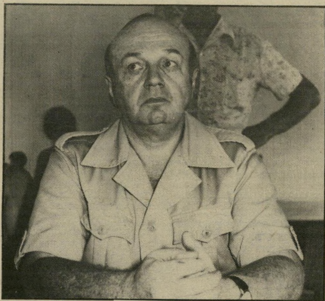
נציג בא"ם תקוע הסכם עם הנאצים

לפני שהספיקו אנשי המישטרה לפעול. אירעו פיצוצים נוספים. בינואר 1972 פוצץ מישורו של האמרק היהודי סול יורוק. שהיה אז בן 83. למרות אזהרות הליגה המשיך האמרגן להביא לאמריקה נגנים ורקדנים רוסיים. שני צעירים לבושים היטב נכנסו למישורו וביקשו לקנות כרטיסים. חמש דקות אחר כך יצאו השניים במהירות, והפקידה ראתה אלוטמאש עולה ממנוחת השולחן.