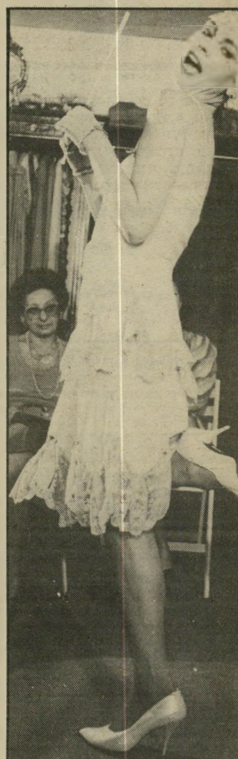
קומביניזון עשוי מלמלה עם כתפיות דקיקות. לאוהבות מראה רומנטי.

שיפוך חדשני אחר לבעלות-העזה הוא לקחת את הכותונת הקיימת ולגזור בה כמה חורים מרובעים ככתפיים, בשרוולים, כמותניים וקרוב לאימרה. מסכיב לכל חור שכזה תפרי סרט אלכסון בצבע כל שהוא וכך תיצרי כותונת קיצית, אזורית ומקורית, מעשה ירידך וללא הוצאה כספית.