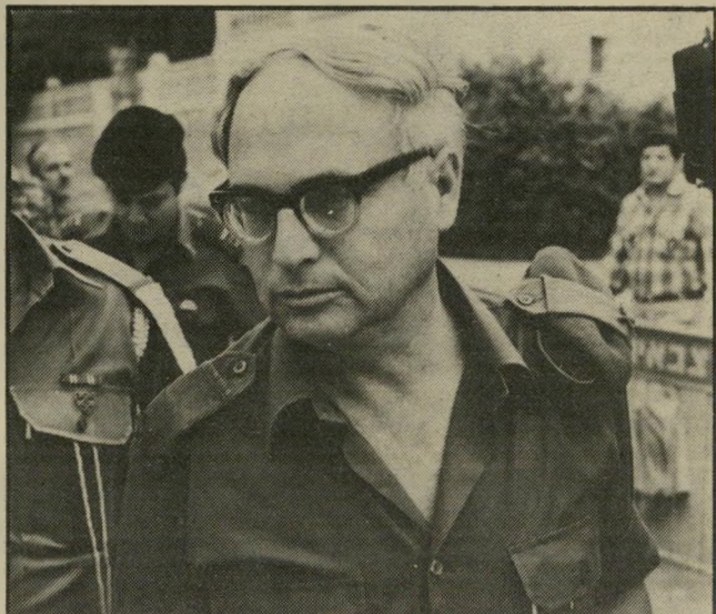
שוסט שטרודזמן* דורח משירות-המבחן

אמרה החוקרת המישטרית לבית-המישפט. "מה פיתאום שאני שאר בבית-החולים?" שאל אלון בתמהון את השופטת, "הרי הרגע שוחררתי מבית-החולים ויש כבר פתק בתיק שאני משוחרר. השופט אמר 15 ימי-מעצר, וזה נגמר. כעת אני רוצה ללכת הביתה". הוא הוסיף כי איננו מבין מניין לקחה אשתו את הרעיון שהוא היה מאושפז שלוש שנים בבית-חולים פסיכיאטרי: "אין שום הוכחה".