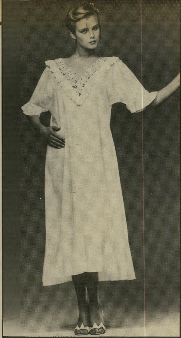
באטיסטי שווייצ'י הוא החומר של כותונת-לילה זו. שהיא באורך אונגתי של עד מתחת לברך. צווארון וי, המעוטר בפרחים עדינים. המחיר: רק בדולארים.