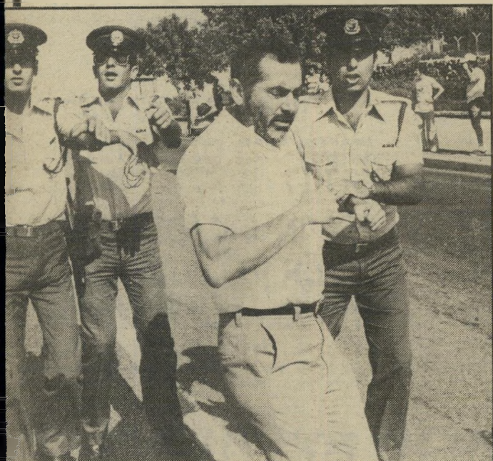
כהנא בהפגנה, 1982 הופעה מסודרת ומרשימה

באוקטובר הוועק סירמן לבניין מגורי של המישלחת הסובייטית לאו"ם. מישו ירה ארבע יריות לחרד שניה, שבו ישנו באותו זמן ארבעת ילדיהם של דיפלומטים סובייטיים. בנס לא נפגע איש. היורה עמד על גג בניין האנטריקולג', ממול, והרובה נמצא שם. (המשך בעמוד 58)