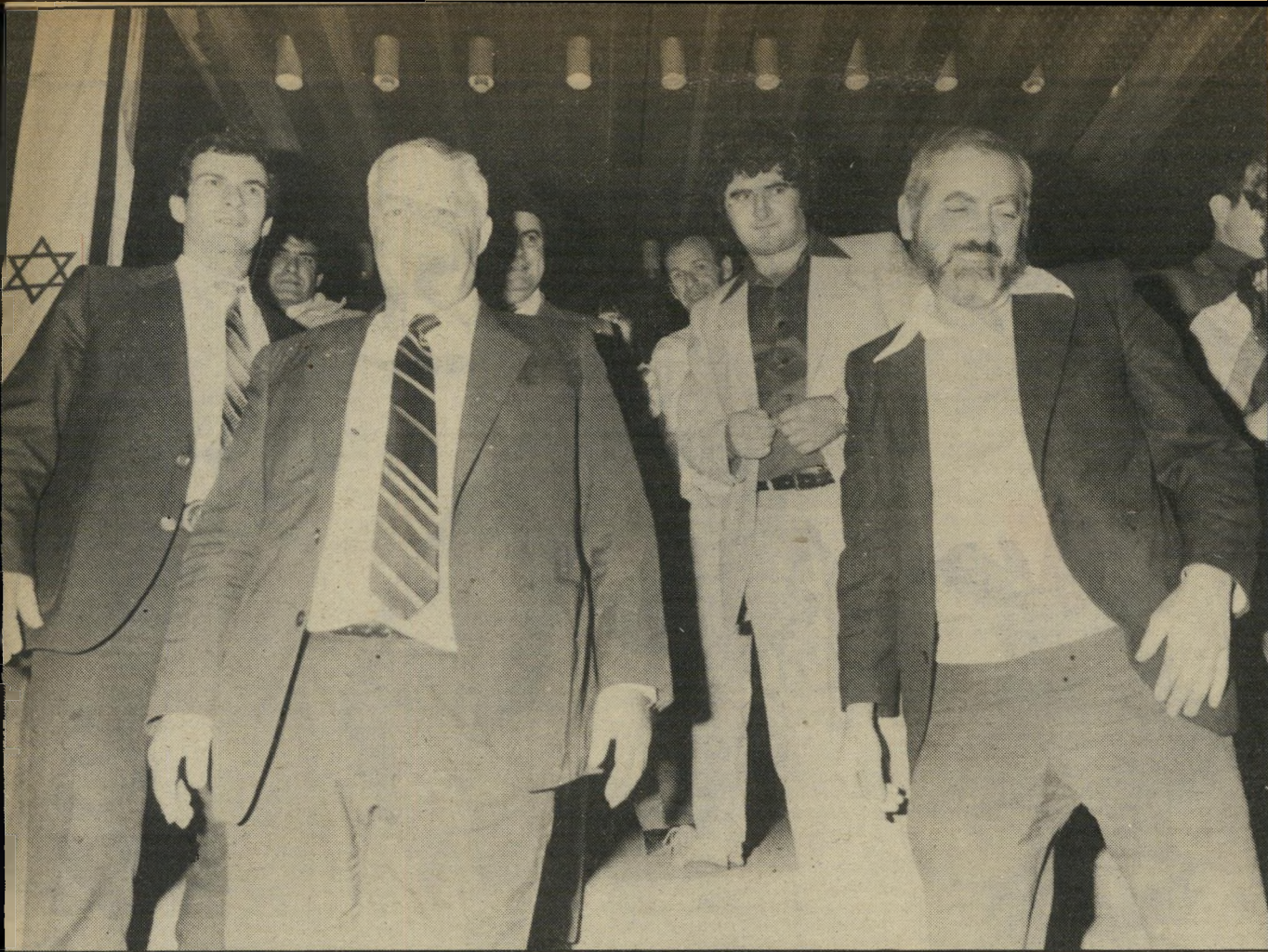
כהנא ושריבטחון שרון, 1982 הערצת-נערים