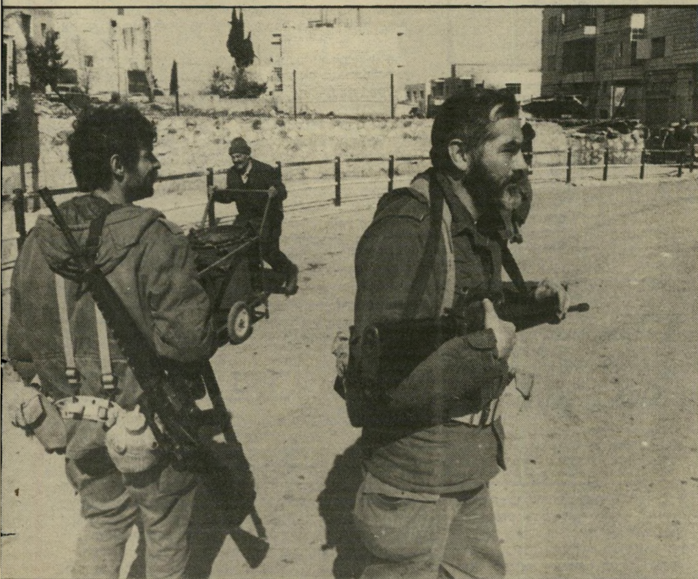
כהנא בשירות מילואים ברמאללה, 1981 חוסר-הגיון

א מריקה צחקה מכל לב, כאשר פיזרו כמה צעירים יהודיים עכברים וצפרדעים במישטרה המהודר של מישלחת-הסחר הסובייטית בניו-יורק. האמריקאים, האוהבים בריחות