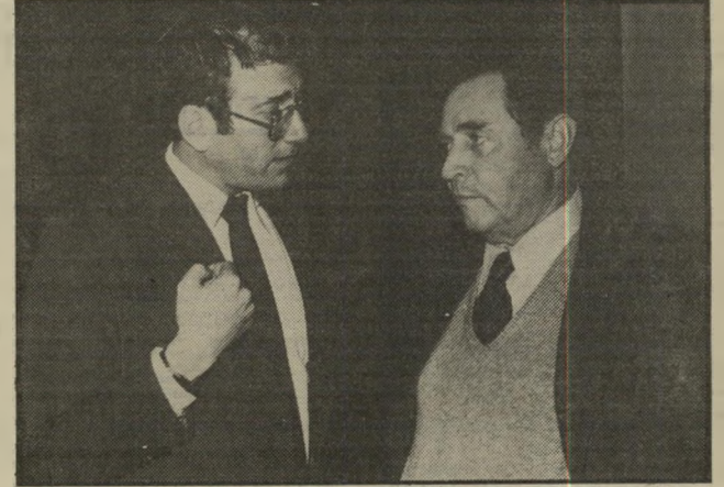
שוסטק ואולמרט. המנוול הצעיר והמנוול הזקן.

בצהרי יום א' שעבר, נכנסו לקפה אפרופו שני גברים. האחד: גבר ממושק כסככות ה"40, שהרגיש כבית" במקום. ואילו השני, שחצה מכבר את קו ה"60, עבר קשיי התבייתות בולטים במקום. השניים התיישבו, כשהצעיר מדבר נמרצות, והמבוגר נראה מבוכלב, כלת"מרכוב. לפתע הגיעה תגבורת לצעיר, בצורת גבר מסורבל, שנחת בככרות ליד הוזג המזון ועזר לצעיר בשטף דיבורו. השניים רחקו בשלישי הגיע ל"מוצא של כבוד".