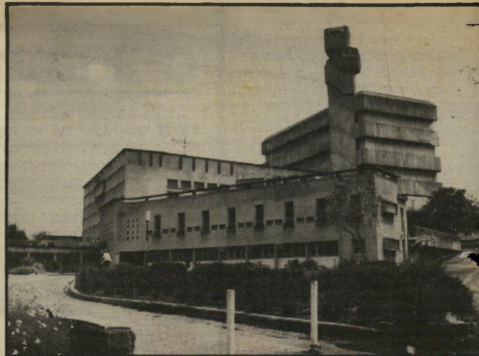
חזית מיכללת בית ברל פרדס באול

כלפי חוץ הכחיש נבון כל קשר לפירסומים ולהשלכותיהם על הרכב הממשלה העתידה. פרס הודיע שבשלב זה הוא אינו מכין ממשלת צללים, ולא אישר שהבטיח דבר לנבון. אבן, לעומת זאת, השתולל מכעס ומוזעם. ממש באותם הימים היה אבן צריך