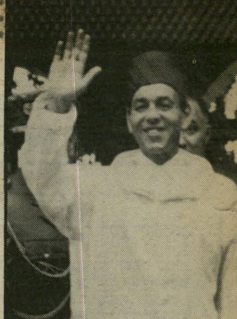
המלך חסן צעד אחרי צעד

הפרופסור לפיסיקה, שרבים רואים בו מהדורה ישראלית של "הרוקטור סטריינג'לב", המדען האגדתי שנתפס לפולחןהיכוח עד שהשתבשה עליו דעתו, השמיע דיעה מקורית. בניגוד לפיצוץ אוטובוסים ערכיים, שאינו מוצא חן בעיני השר, הוא הצדיק את ההתנקשות כחייבים של ראשי העיריית בגדה המערבית, שהסתיימה בקטיעת רגליהם של שניים מהם.