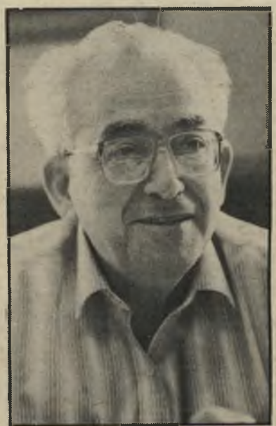
מנכ"ל „בנק ישראל“ סריג לא ידע

סכום של יותר משיבעה מיליון שקל, הנובע ממכירת איגרות-החוב שלו בבנק ישראל. במיקרה אחר אישר גלעד את בקשתה של ב' להעביר כסף לחשבונה בבנק אוצר החייל ממכירת המילות שלה. הוא טילפן למישה מנכ"ל אותו הבנק, שהכיר אותו אישית, ואישר את ההעברה וכשהכסף איתר להגיע, הסניר כי ההעברה מתעכבת כיוון שעדיין לא נערך החישוב הסופי במחשב. על סמך הבטחתו הטלפונית והסבריו של גלעד, הסכים בנק אוצר החייל לרכוש לגנבת ב' תפ"ס ומ"ת בסכום של 11 מיליון שקל. וכך הלאה וכך הלאה. על סמך הודעה טלפונית שלו לבנק דיסקונט בפתח-תקווה, וזכה חשבונו של ה' והוא קיבל המחאה בנקאית על סך 1.2 מיליון שקל. משכסף לא הועבר אחרי „יום יומיים“ כמובטח, פנו מנהל הסניף וסגנו אל גלעד. שהבטיח שהכסף בשלבי העברה