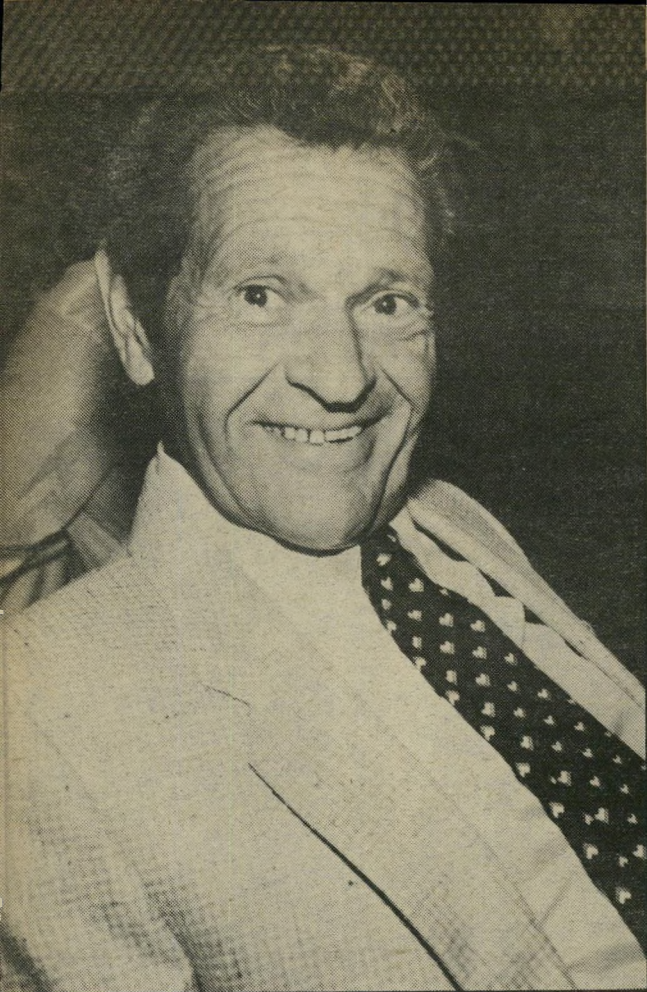
השופט סגלפון זה מגיע, אבל ששאלות יהיו תרבותיות