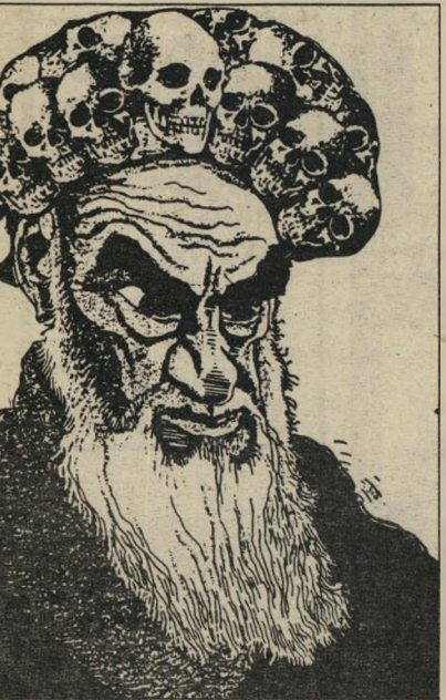
חומייני חור שחור כפייתי

לאוכלת בניה, שטרפה את רת-העבודה ואת רעיון ההגשמה העצמית, תוך כדי הפיכת יהודי ארץ-ישראל לבני רת יהודית אחרת, שכל קשר בינה ובין המוסר-היהודי מיקרי בהחלט. כמעט הספרים שנסקרו כאן מצוייה תמונה