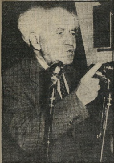
בן-גוריון חלום על גרלים