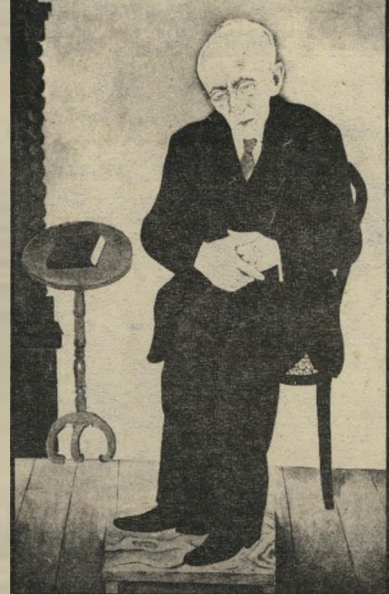
הוגה אחריהם ניסיון לחליין את היהדות