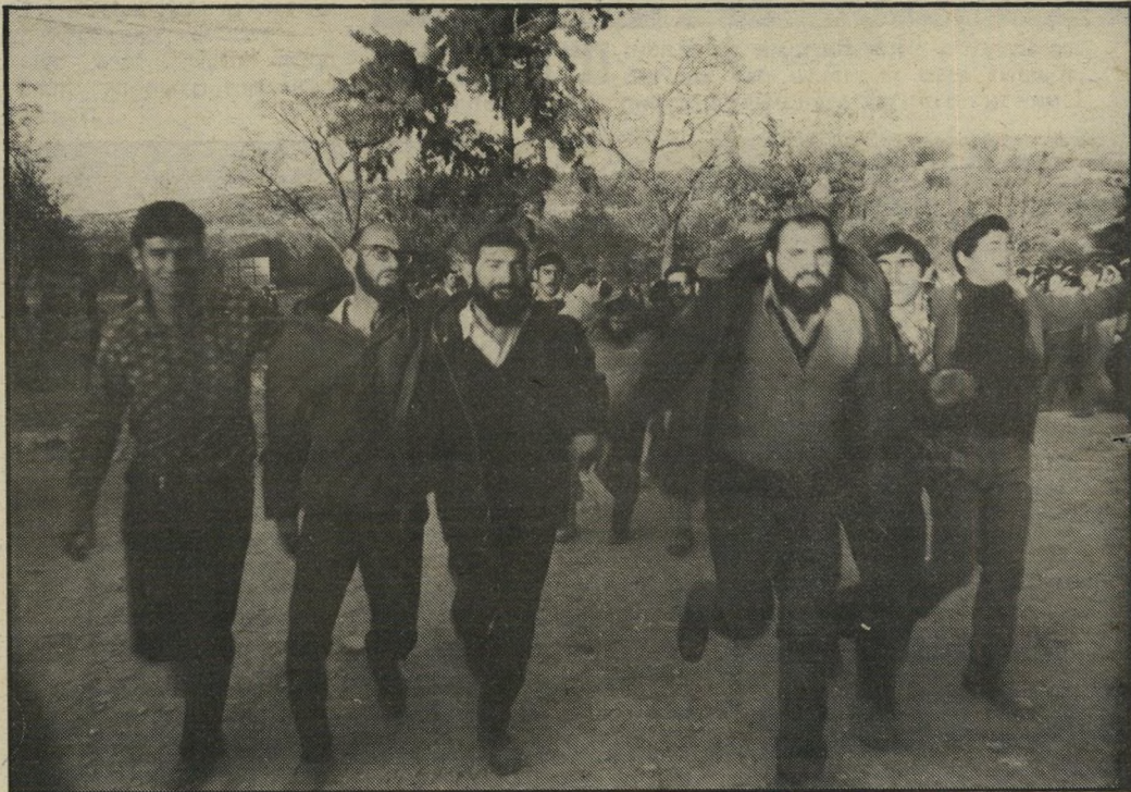
לווינגר בפעולת התנחלות החוויה בקיבוץ לביא שינתה את ההיסטוריה

קנאים ישראלית: ההתנחלות בחברון. כמהרה התארגנה קבוצה של יוזמים, רובם רתיים. הם פנו אל הגופים הפוליטיים וניסו לשכנעם לצרף את השטחים הכבושים לארץ ישראל.