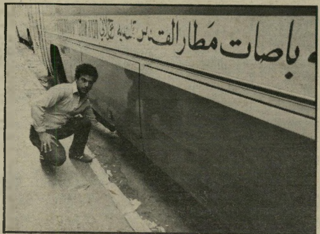
אחר האוטובוסים שבהם הוטמנו הפצצות חבלי משיח כרוכים בדם

ביום את בוא הגאולה, ולפוצץ את הכנסת. על אחת כמה וכמה שגוף מזויין כזה יכריז מלחמה על כל ממשלה העשויה להביע נכונות להחזיר חלקים מנחלת-האבות". ברור שכל ממשלה שתביע נכונות למשאומתן על פשרה טריטוריאלית בגדה המערבית או ברמת-הגולן, או ממשלה שתכריז על נכונות להחזיר שטחים, או שתחליט להחזיר שטחים כפועל, תהווה מיד מטרה למחתרת כזאת, הממלאה כמה תנאים: זוהי