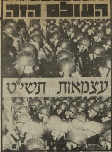
העולם הזה 1128 תאריך: 12.5.1959