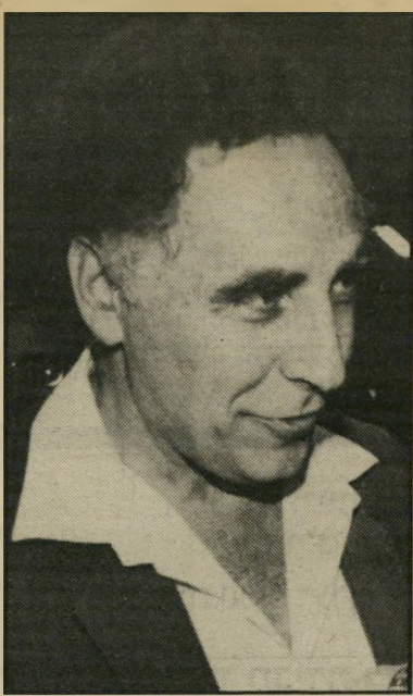
שריאהוצר בהן-דאורגד יש שני אשמים

מי שביקר באמריקה או בחנויות רשת/תות-השיווק בערים הגדולות באירופה, מכיר את התופעה של מכירה במחירי-מציאה, או במחיר מופחת. שם זה על אמת. אצלנו התופעה קרוייה הנחות בלשון רבים והנחה בלשון יחיד. שם, כשנותנים הנחה היא אמיתית והמחיר הישן והחדש, המופחת, מודפס על תווית ממוצר. אצלנו העניין שונה. והקונים, תסלחו לי, מטומטמים. הנה סיפור המעשה. עם תווית, בלי תווית. באחת מרשתות השיווק הגדולות בארץ, החליטו לנסות למכור בשיטה חדשה של הנחות. לא, שחס וחלילה נתנו הנחה על החולצות, אלא פשוט צירפו תוויות לכל חולצה, שהיא נמכרת בהנחה של 40 אחוז. את תווית ההנחה צירפו לחולצות רק בחנויות מסוימות. ביתר החנויות של הרשת מכרו באותו מחיר, אך בלי תווית של 40% הנחה. מה קרה תוך כמה ימים נקנו כל החולצות שהיו בהנחה. כל החולצות בחנויות ללא הנחה, לא נמכרו. המסקנה: לא קונים, אפילו כשצריכים, כשאין הנחה. כן קונים, אפילו כשלא צריכים, כשיש הנחה.