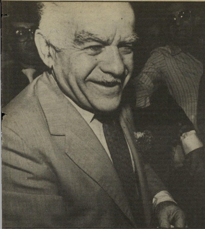
המנצח ראש-הממשלה, יצחק שמיר, מחייך לפני שהוא מטיל את המעטפה לקלפי. שמיר הצביע, הצטלם מעט לצד חברי מרכז ועזב את המקום. כמוהו נהג גם ארנס, ששב רק לפנות-בוקר.