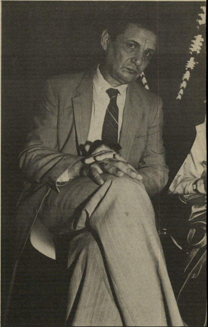
בדרך הנכונה שר-האוצר הקודם, יורם ארידור, ממתין, כשראנה רבה ניכרת בפניו, לתוצאות ההצבעה. גם הוא לא האמין שחבריו יזכרו לו לטובה את הכלכלה הנכונה.