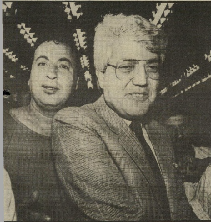
ניצחון חמוץ סגן ראש-הממשלה מחייך לפני שנודע לו, שהוא דורג אחרי ארנס. בזמן הספירה קיבל לוי דיווי-חיס שוטפים מחדר הספירה. למטה, מנצח נוסף: אליהו בן-אלישר.