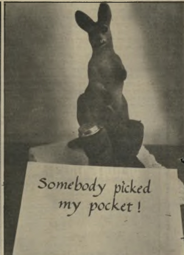
מישהו בייס אותי גונבים אפילו זבובים