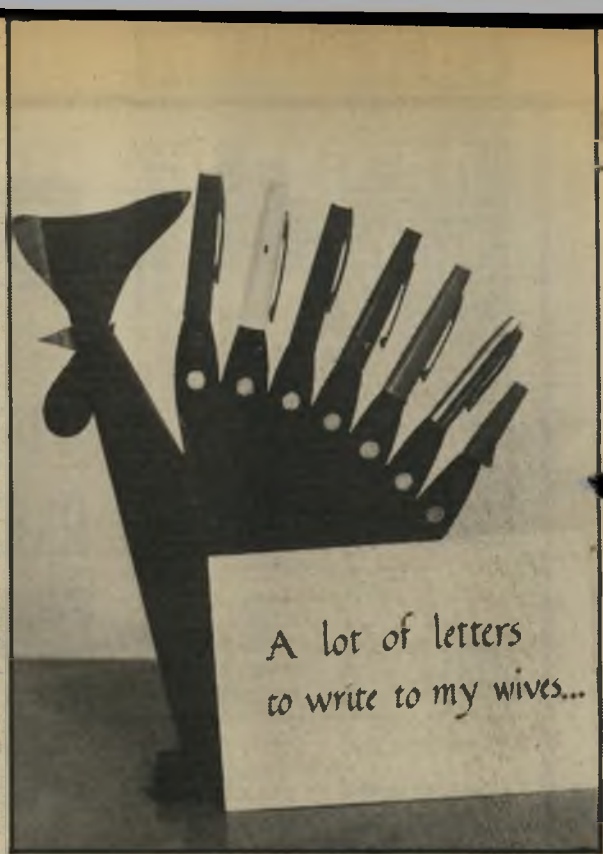
מיכתבים לכל הנשים שלי רכוש ראשון: אופנוע