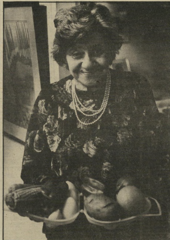
נינה וסירות מלאכותיים צחוק, שירה וחמשירים