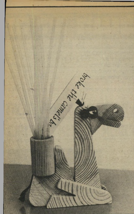
הקש ששבר את גב הגמל טלפון ועוד טלפון

שעות ביום עליירי ממשלת ישראל. שוב נזכרת נינה קציר בנענועים לימי היותה רעיית נשיא המדינה: הייתי מאוד פעילה באירגוני נשים, כשהייתי אשת־נשיא. כיום אינני פעילה כלל, לא מפני שאני לא רוצה, אלא מפני שלא הציעו לי. ביקרתי את פצועי־צה"ל ברצינות. לא עברתי לידם ולחצתי יריים, ישבתי איתם ובאמת היה איכפת לי. באמת עזרתי."