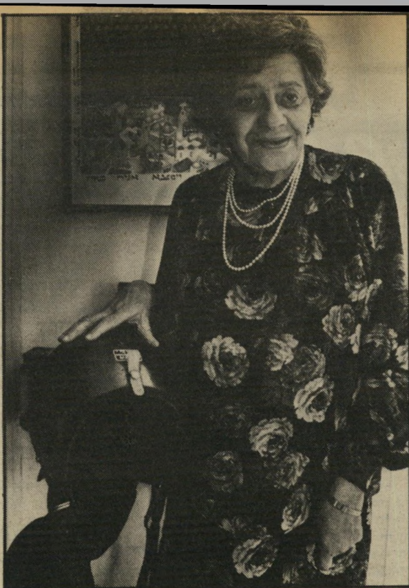
ליד קסרת רוכבי־האופנוע טוב מצוואר־אשה

כי אם היית מסרב, האשה היתה הולכת עם סטיגמה לכל חייה, ומי רצה לעולל לאם עכריה עוול שכזה.