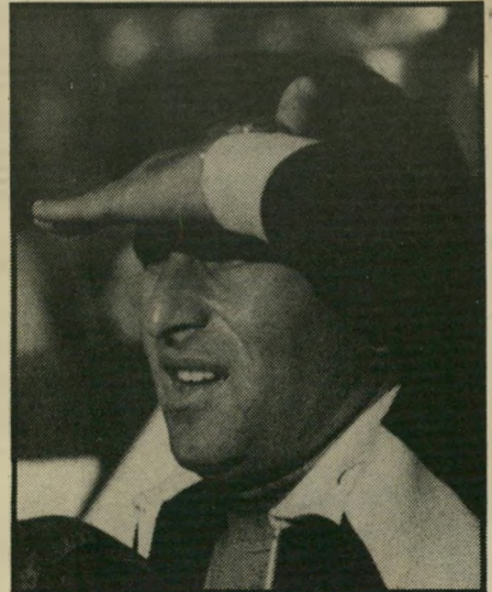
מאמן זלצר מי שמחזר, אסור לו לאחר

כדורגלני הפועל תל-אביב, שירדו מהאר טובוס שהסיע אותם למישחק במיגרש בעיירה יבנה בשבת, לא ידעו להסביר לעצמם את מימטר האכזבים, הקללות והגידופים שירדו על ראשם מקהל האוהדים המקומי שקיבל אותם, הרבה לפני ההתרחשויות הספורטיביות במיגרש. גילויי-שנאה שכזה לפני מישחק, או תוצאה