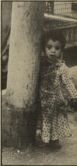
ילד בכיכר השיחרור קדימה, יאללה קדימה!

אפשר לספר עוד אלף ואחד סיפורים על מצריים — איך רפנו, למרות שהיו לנו כרטיסים, אחרי הרכבת הצרפתית ללוקסור; ואיך